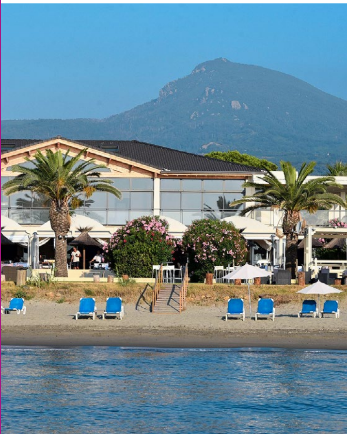
Basispreis (CHF) pro Person für 1 Woche inkl. Frühstück