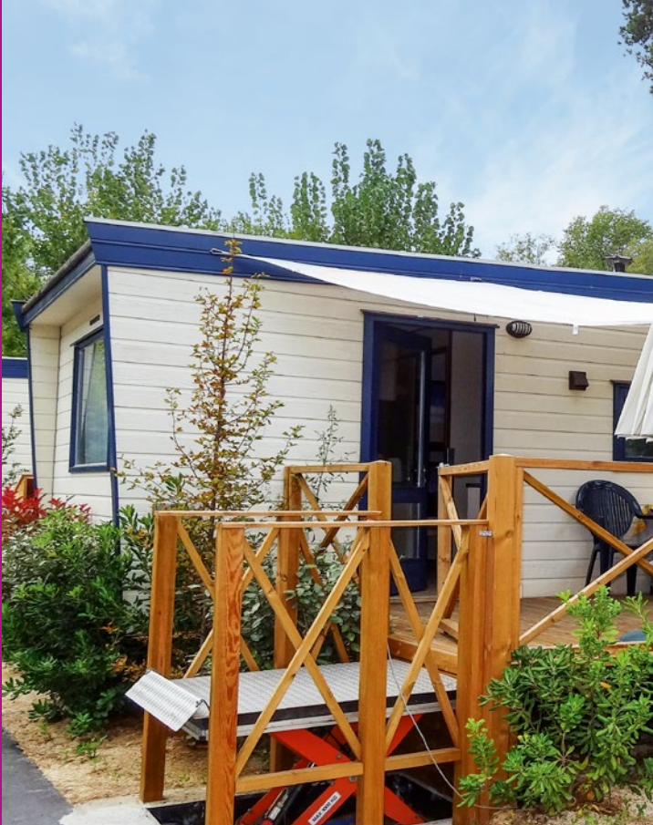
Basispreis (CHF) pro Mobilhome für 1 Woche ohne Mahlzeiten